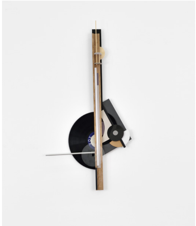
Rainier Lericolais, Vox Instrument , 2018. Vinyle, carton, bande magnétique, bois, 87 × 46 cm.