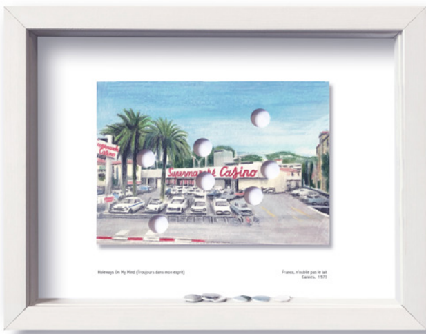
Thierry Lagalla, Holeways On My Mind (troujours dans mon esprit) , 2023. Carte postale dessinée, trous, confetti, cadre, 20 × 26 cm, courtesy de l'artiste et Espace à vendre, Nice.