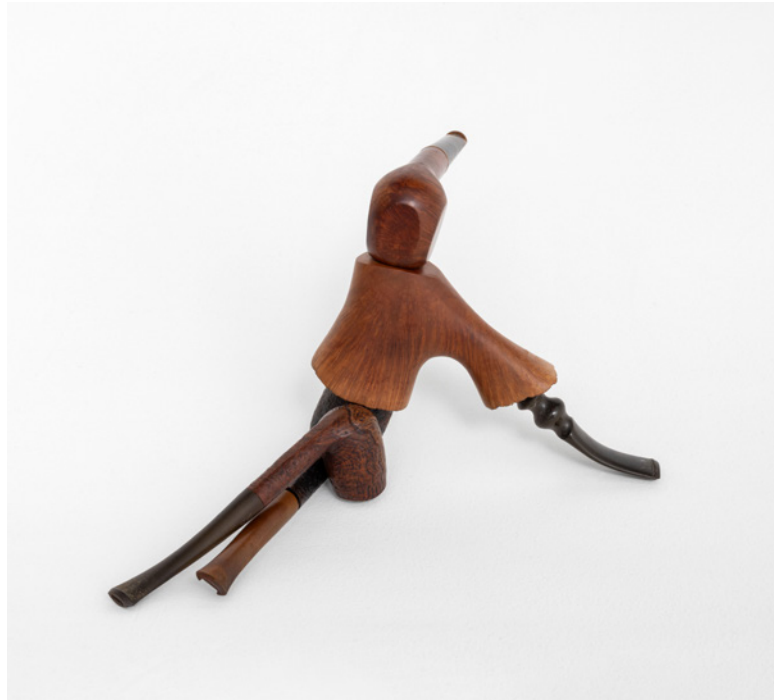
Richard Fauquet, François , 2023. Bois, acrylique, 14,5 × 26,2 × 16 cm, courtesy de l'artiste et Art: Concept, Paris. Crédit photo Romain Darnaud.