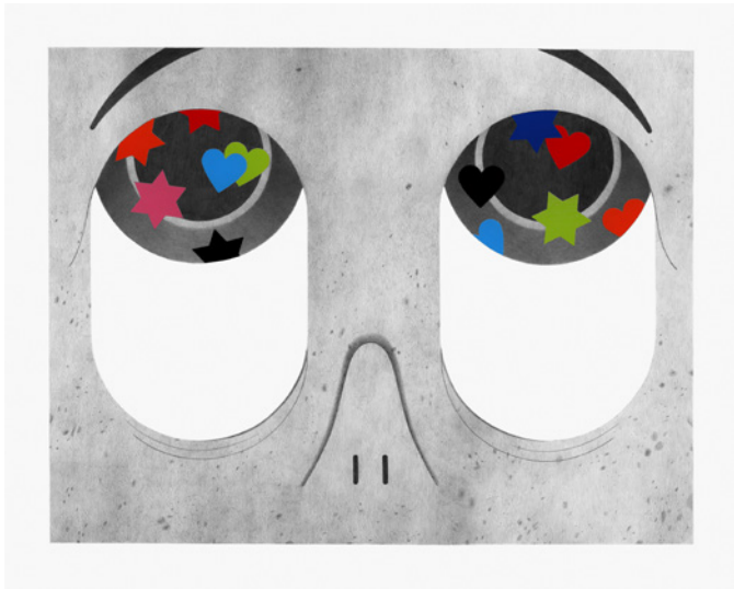
Louise Aleksiejew, Ahegao , 2024. Dessin sur papier et gommettes, 40 × 50 cm, courtesy de l'artiste et galerie Bernard Jordan, Paris.