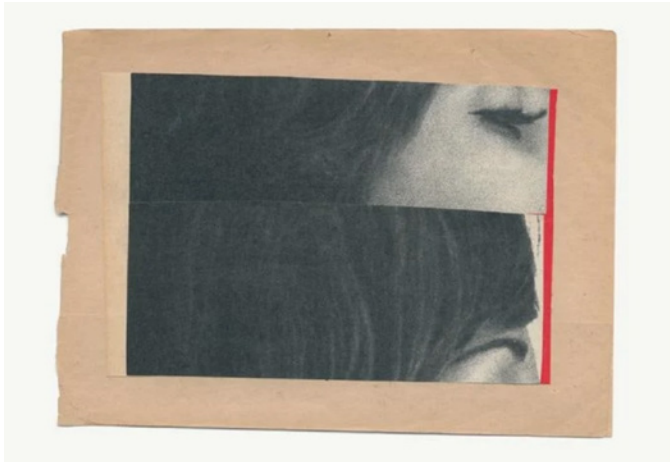
Katrien De Blauwer, Single Cuts 113 , 2015. Collage, cadre bois blanc et verre musée, 37 × 30 cm, courtesy de l'artiste et galerie Les filles du calvaire, Paris.